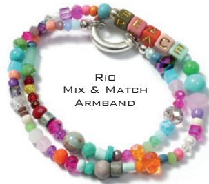
RIO MIX & MATCH ARM BAND