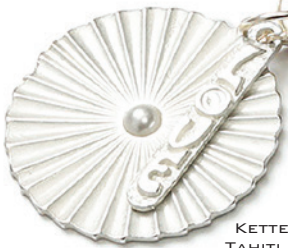
KETTENDESIGN 1328 TAHITI 88 SILVERSHINY

BAROCKE, NATÜRLICH GEWACHSENE SÜSSWASSERPERLEN ITALIENISCHE GLASSCHLIFFELEMENTE ZAMAK VEREDELT