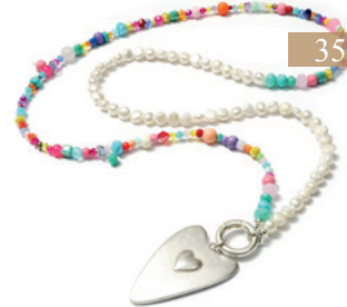
KETTENDESIGN 1311 LOVE 88 SILVERSHINY