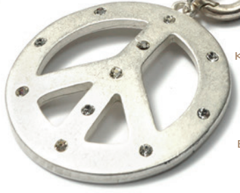
KETTENDSIGN 1 292 SILVERSHINY GOLDSHINY SAHARA BLACKBEAUTY