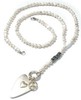
KETTENDESIGN 1240 BORABORA 100 SILVERSHINY