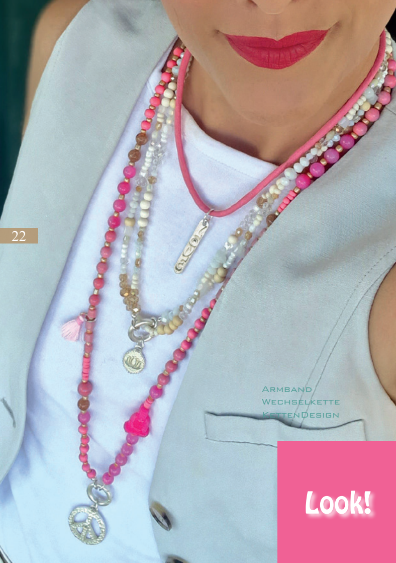
ARM BAND WECHSELKETTE KETTENDESIGN