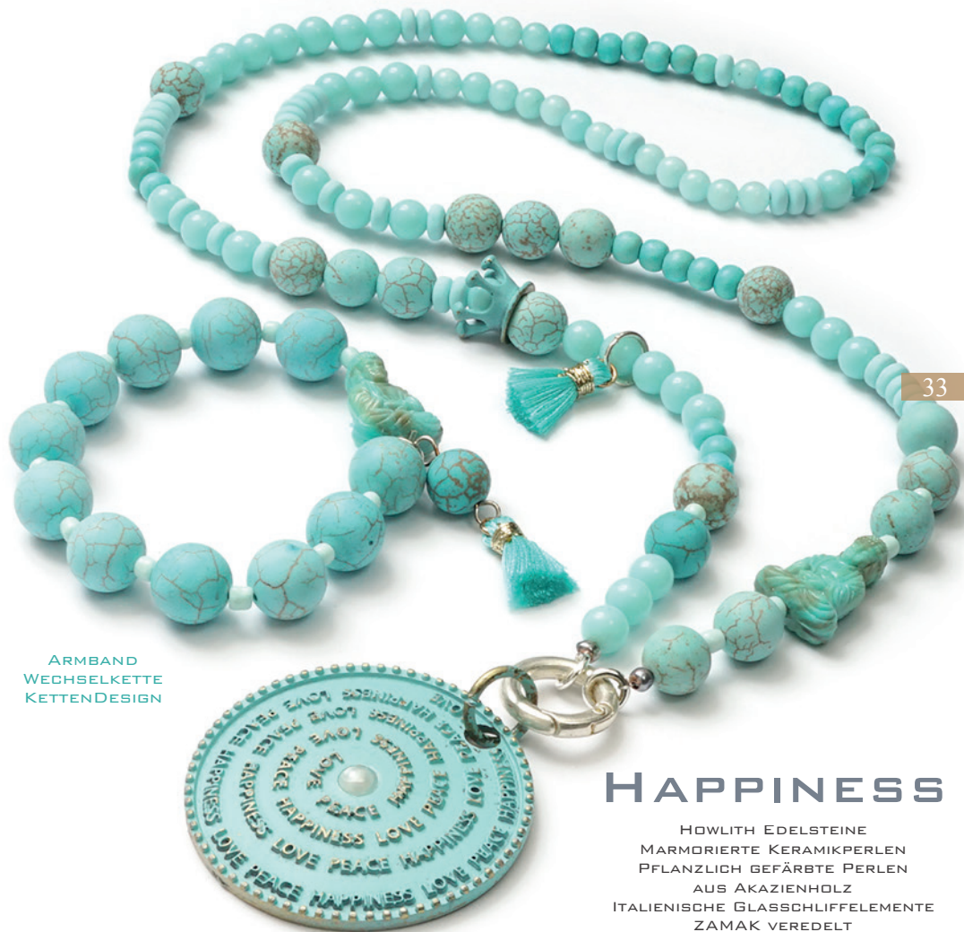
ARM BAND WECHSELKETTE KETTENDSIGN