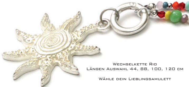
WECHSELKETTE RIO LÄNGEN AUSWAHL 44, 88, 100, 120 CM WÄHLE DEIN LIEBLINGSAMULETT