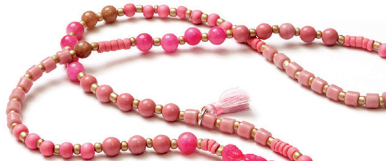
JADE EDELSTEINE PERLEN AUS AKAZIENHOLZ NATÜRLICHE KOKUS DREAMBEADS POLYMERE CHARMS SEIDENQUASTE MIT SCHLEIFE HANDGEFERTIGTER BUDDHA ZAMAK VEREDELT