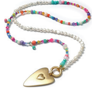
KETTENDESIGN 1312 LOVE 88 GOLDSHINY