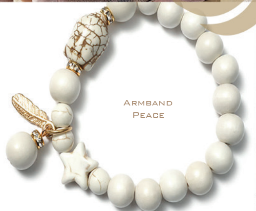
ARM BAND PEACE