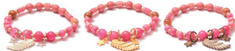
WECHSELKETTEN, KETTENDESIGNS, WECHSELARMBÄNDER, ARMBANDDESIGNS IN DEN DESIGNFARBEN SILVERSHINY, GOLDSHINY, SAHARA, TÜRKIS, BLACKBEAUTY