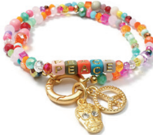
ARM BAND DESIGN 2078 RIO

ARM BAND WECHSELKETTE KETTENDESIGN FUSSKETTCHEN