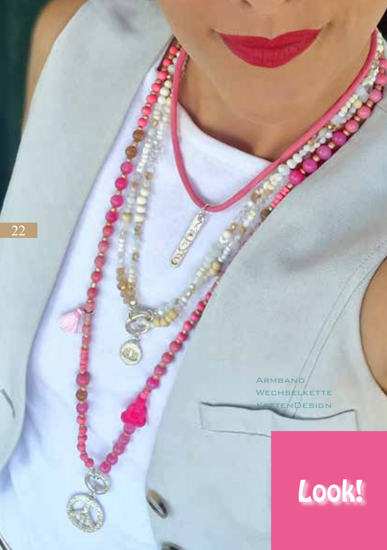
ARMAND WECHSELKETTE KETTENDESIGN