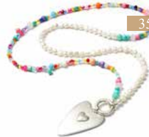
KETTENDSIGN 1311 LOVE 88 SILVERSHINY