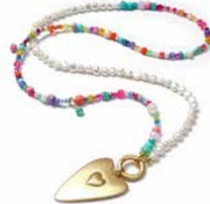
KETTENDSIGN 1312 LOVE 88 GOLDSHINY