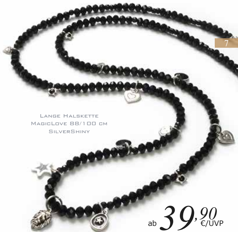
LANGE HALSKETTE MAGICLOVE 88/100 CM SILVERSHINY