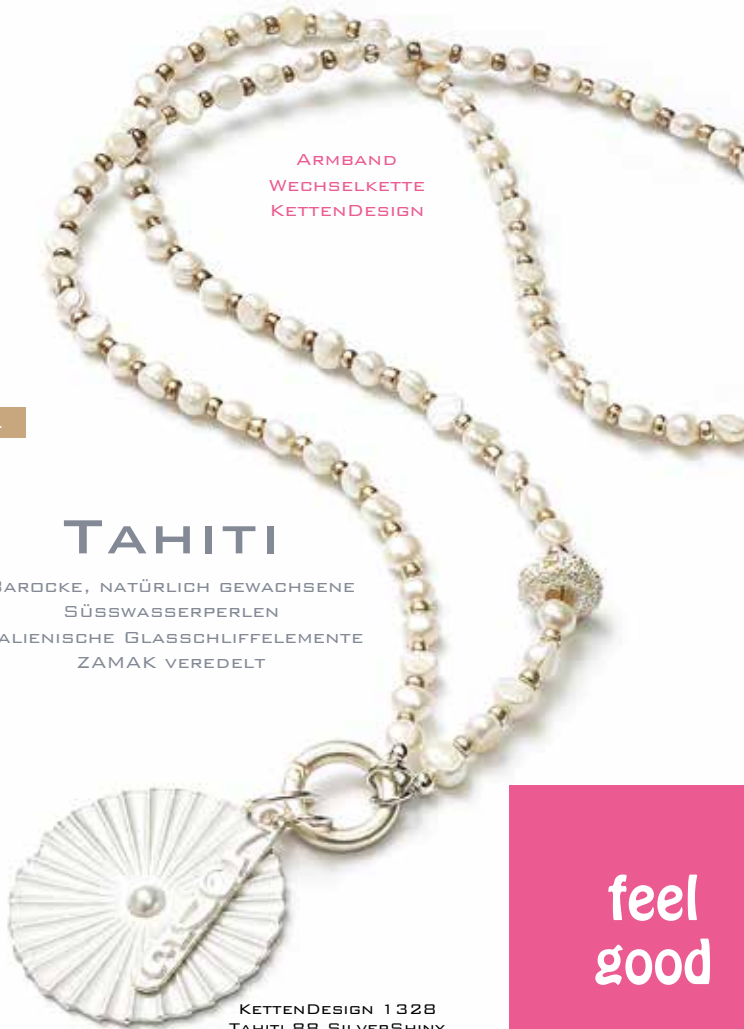
KETTENDSIGN 1328 TAHITI 88 SILVERSHINY

BAROCKE, NATÜRLICH GEWACHSENE SÜSSWASSERPERLEN ITALIENISCHE GLASSCHLIFFELEMENTE ZAMAK VEREDELT