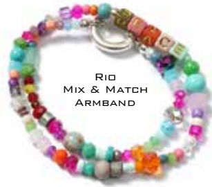
RIO MIX & MATCH ARM BAND

ARM BAND WECHSELKETTE KETTENDESIGN FUSSKETTCHEN