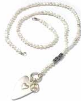
KETTENDSIGN 1240 BORABORA 100 SILVERSHINY