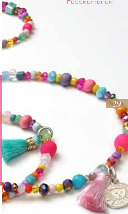
ARM BAND DESIGN 2078 RIO